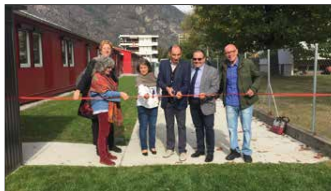
Scuola infanzia SUD

d'entrata della piazza della tecnica ferroviaria. Dopo l'acquisizione degli spazi si è proceduto all'esecuzione di tutti i lavori necessari e, nonostante il poco tempo a disposizione, grazie alla professionalità di tutte le ditte e dell'architetto che ha seguito i lavori e del personale dell'Ufficio tecnico comunale, è stato possibile permettere agli allievi di iniziare l'anno scolastico il 29 agosto 2016. Oltre ad ospitare i bambini delle SI di Biasca e di Pollegio, la nuova sede ospita pure una sezione di "scuola speciale".