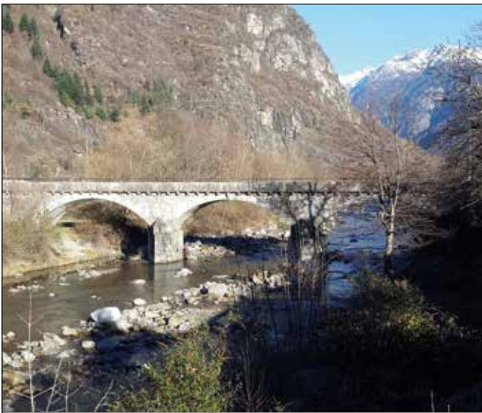
Ponte vecchio sul Brenno

Tra gli investimenti prioritari figurano pure gli interventi sugli argini del fiume Brenno in zona al Ponte per garantirne la massima sicurezza, l'ampliamento del cimitero, con un importo di circa 1 milione di franchi, la realizzazione delle canalizzazioni per 1,4 milioni e l'ammodernamento dei parchi giochi.