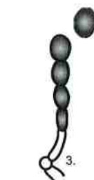
Clamidospore a parete spessa