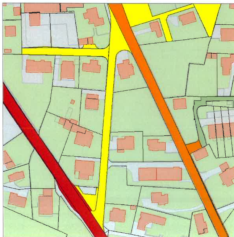
Estratto Piano del Traffico comunale

Il collegamento viario interessato, rappresentato in giallo, è definito come strada di quartiere dal Piano del Traffico comunale (PT).