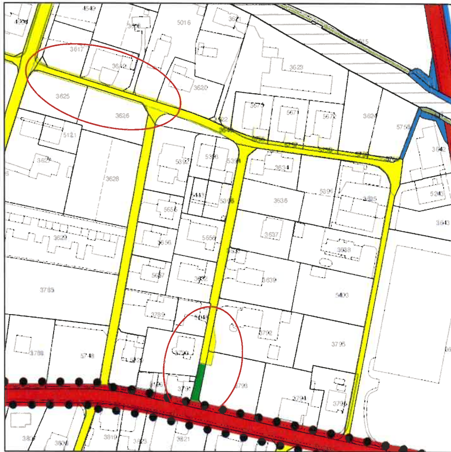
Estratto Piano del Traffico comunale

I collegamenti viari interessati, rappresentati in giallo, sono definiti come strade di quartiere dal Piano del Traffico comunale (PT).